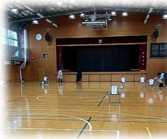
全体会はお隣の瀬田中学校の体育館で行いました