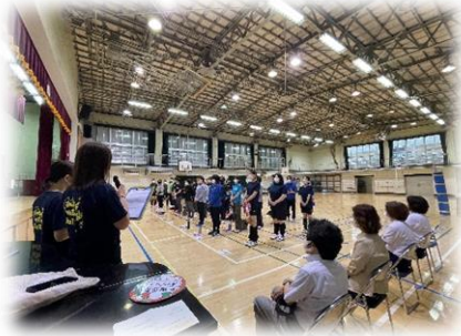
春季大会開会式の様子

今年度は瀬田小学校が常任理事校です。 春季大会開会式に併せ、6月25日に春季親睦大会、 10月22日(予定)に秋季ブロック大会が瀬田小学校 で行われます。ブロック代表校は全都大会に出場 します。新型コロナウイルス感染予防の観点から、 無観客試合となりますが、バレー部の皆様、頑張り てください！